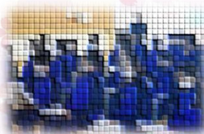
生徒会オリエンテーション