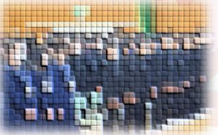
在校生、歓迎の合唱